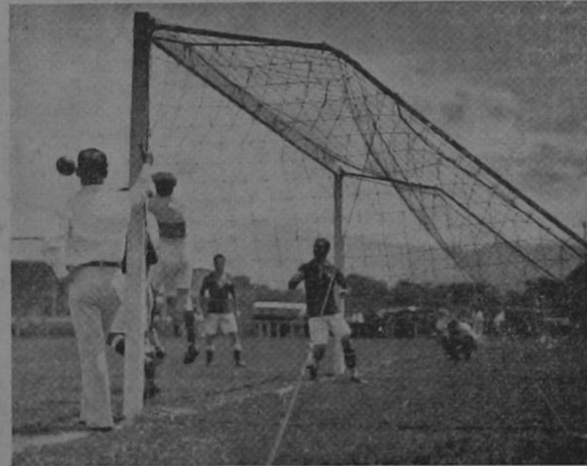
Gráfica del juego de ayer Audax - Libertad